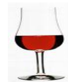
8 cl starkvin